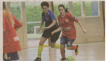
→ Une phase entre Valognes et Quettotot.