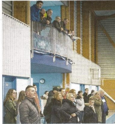
→ Des spectateurs attentifs aux prestations des féminines.