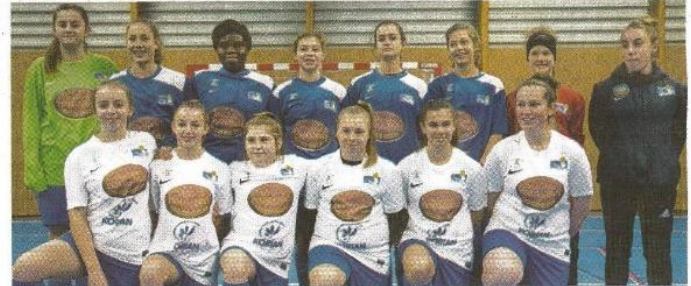
→ Les U15 de Cherbourg.