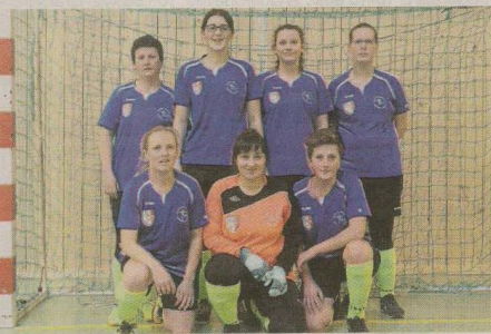
→ L'entente Quettotot/Rauville/Bricquebosq a terminé 4 e .