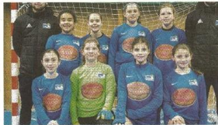
→ Les U13 de Cherbourg.