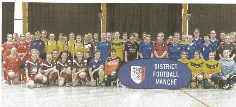
→ FUTSAL : Les phases finales du Challenge futsal féminin se sont déroulées sur deux jours, au complexe Marcel-Lechanoine à Valognes. Après les U13 et les U16 samedi, les seniors ont pris le relais le lendemain. Huit équipes étaient rassemblées dans cette catégorie : Cherbourg, Valognes, Négreville, E. Quettetot-Rauville-Bricquebosq, Carentan, Pont-Hébert, Gavray et Jeunesse Cénillaise.