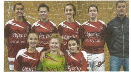
→ Les U15 de Plain Cotentin.