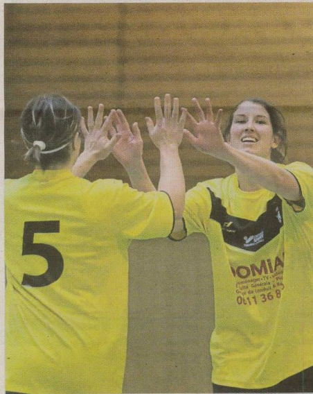
→ La joie des Négrevillaises, qui ont dominé cette journée de futsal féminin et qui représenteront la Manche lors de la finale régionale, aux côtés des Valognaises.