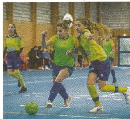
→ Les U13 de Pointe Hague et Plain Cotentin.

Demain : 10 h 00 à 16 h 00 : Seniors : Négreville, Cherbourg, Valognes, E. Quettetot-Rauville-Bricquebosq, Gavray, J. Cenillaise, Carentan, Pont-Hébert.