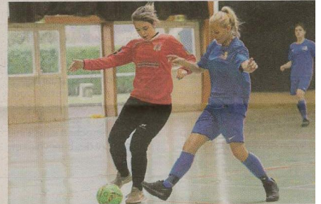
→ Duel entre une Cherbourgeoise et une Carentanaise.