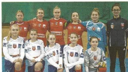
→ Les U15 de Valognes.