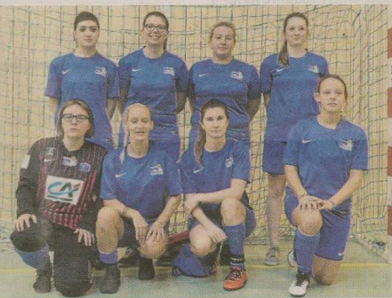
→ L'AS Cherbourg n'est pas passée loin de la qualification pour la finale régionale.