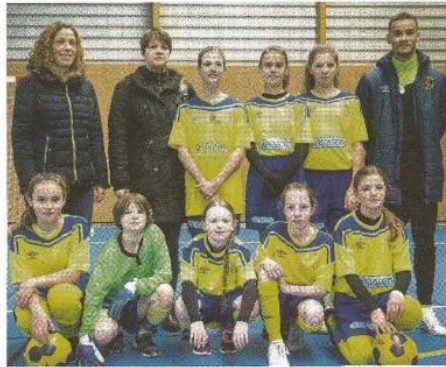
→ Les U13 de Pointe Hague.

La semaine dernière, toutes se sont retrouvées à Vasteville pour le secteur du Nord-Cotentin. Les meilleures sont qualifiées pour la finale à Valognes (voir encadré).