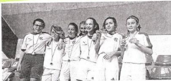
Les U13 féminines de l'ES Coutances jouaient, samedi, les finales départementales de futsal, à Valognes. En présence de six équipes, elles termineront 2 e derrière l'AS Valognes, à égalité de points, mais battues à la différence de buts. Elles se qualifient, avec Valognes, pour les finales régionales, samedi 24 février, à Fleury-sur-Orne (Calvados).