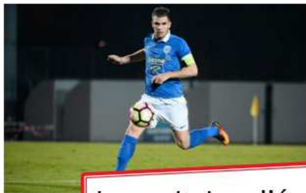
Le capitaine d'équipe