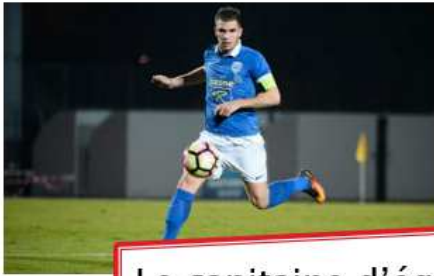
Le capitaine d'équipe