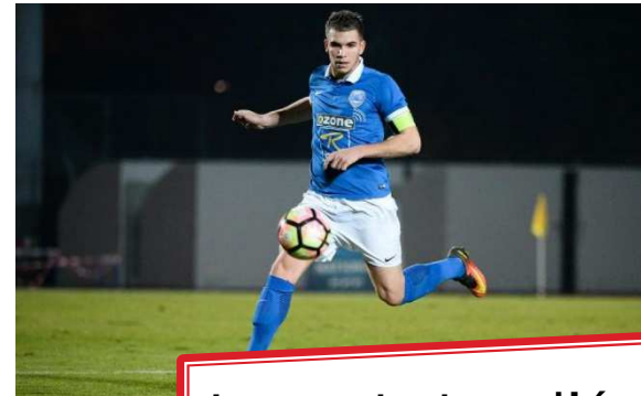
Le capitaine d'équipe