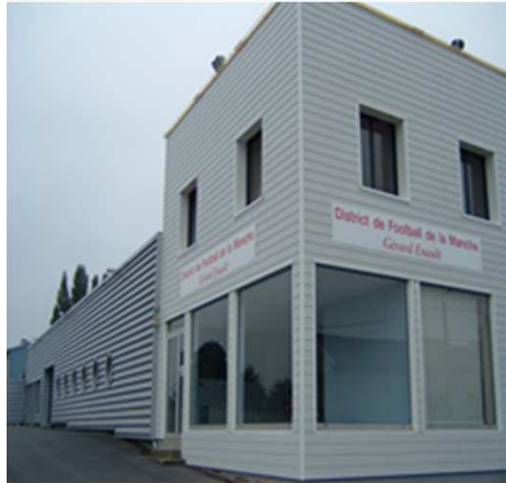
Siège social à PONT-HEBERT